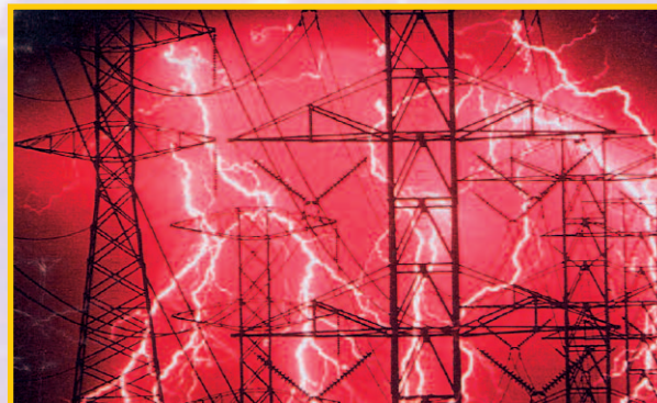
Schon elektromagnetische Felder von Starkstromleitungen beeinflussen die Ionosphäre meßbar.

chemischen Abläufe, sämtliche Prozesse in der Natur, werden folglich durch Energie gelenkt.