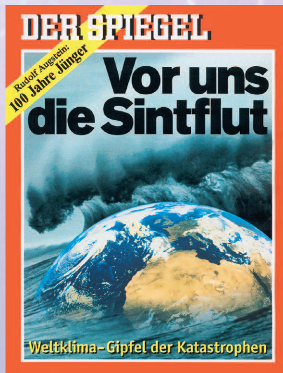
Spiegel-Cover vom 20. März 1995 zur Klimaerwärmung: Seit Jahrzehnten auf der falschen Spur.