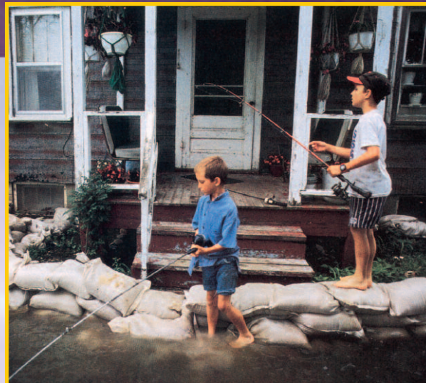
Aufgrund des durch Elektrosmog gestörten Wasserkreislaufs häufen sich Überschwemmungen.

Wollen wir dem wahren Grund für die Klimaerwärmung auf die Spur kommen, dürfen wir eines nie außer acht lassen: Wir leben in einer elektrischen und magnetischen Welt. Alle